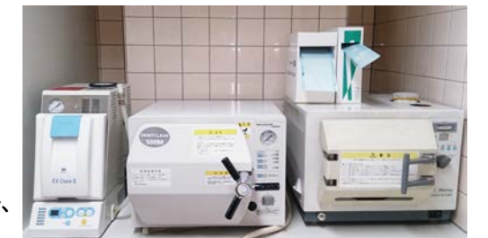
左よりEXクレープ、オートクレープ、ケミクレープ

高圧アルコール蒸気による殺菌をします。殺菌効果が高いと同時に器具が錆びるのをさけることができます。